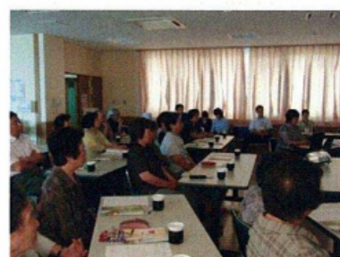
第二弾 6月29日森吉地区