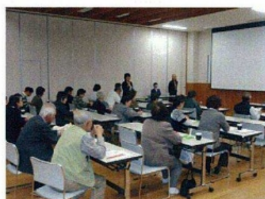
真剣に耳を傾ける参加者

鷹巣地区では28名の参加があり、参加者からは「映像を交えながらのお話はとても分かり易く参考になった。」とのこと感想があり、関心をもっていただけました。